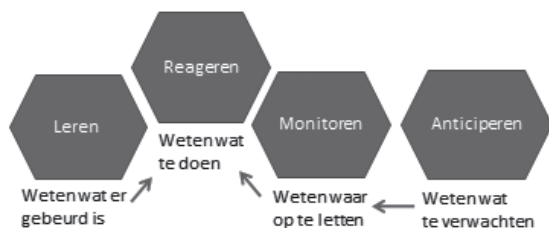
Figuur 1 De vier 'hoekstenen' of kernvermogens van resilience (naar Hollnagel, 2011a)